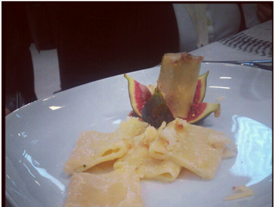
@IIDolcecrear - Pacchero con fichi e formaggio montevole #foodbloggers #foodbloggersitaliani #gdfsalone2012 http://t.co/VvURmvJI - October 28