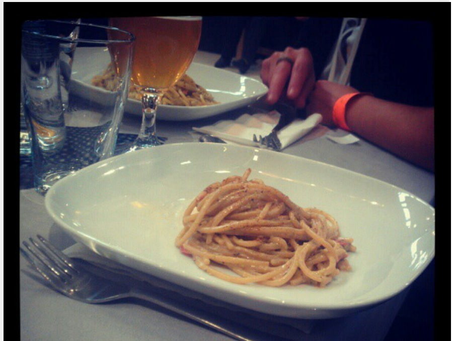
@ILDolcecrear - Spaghetti i con pistacchio di Bronte e liquirizia #gdfsalone2012 #foodbloggersitaliani @giallaforrelli http://t.co/RIXTbOan - October 28