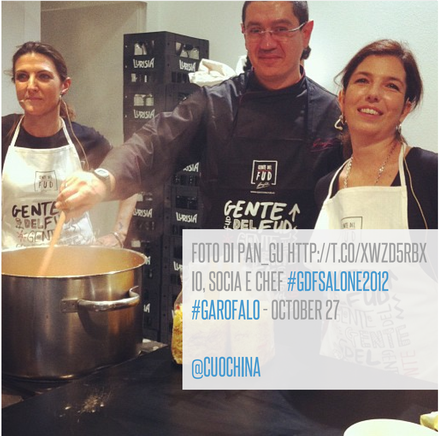
FOTO DI PAN_GU HTTP://T.CO/XWZD5RBX IO, SOCIA E CHEF #GDFSALONE2012 #GAROFALO - OCTOBER 27