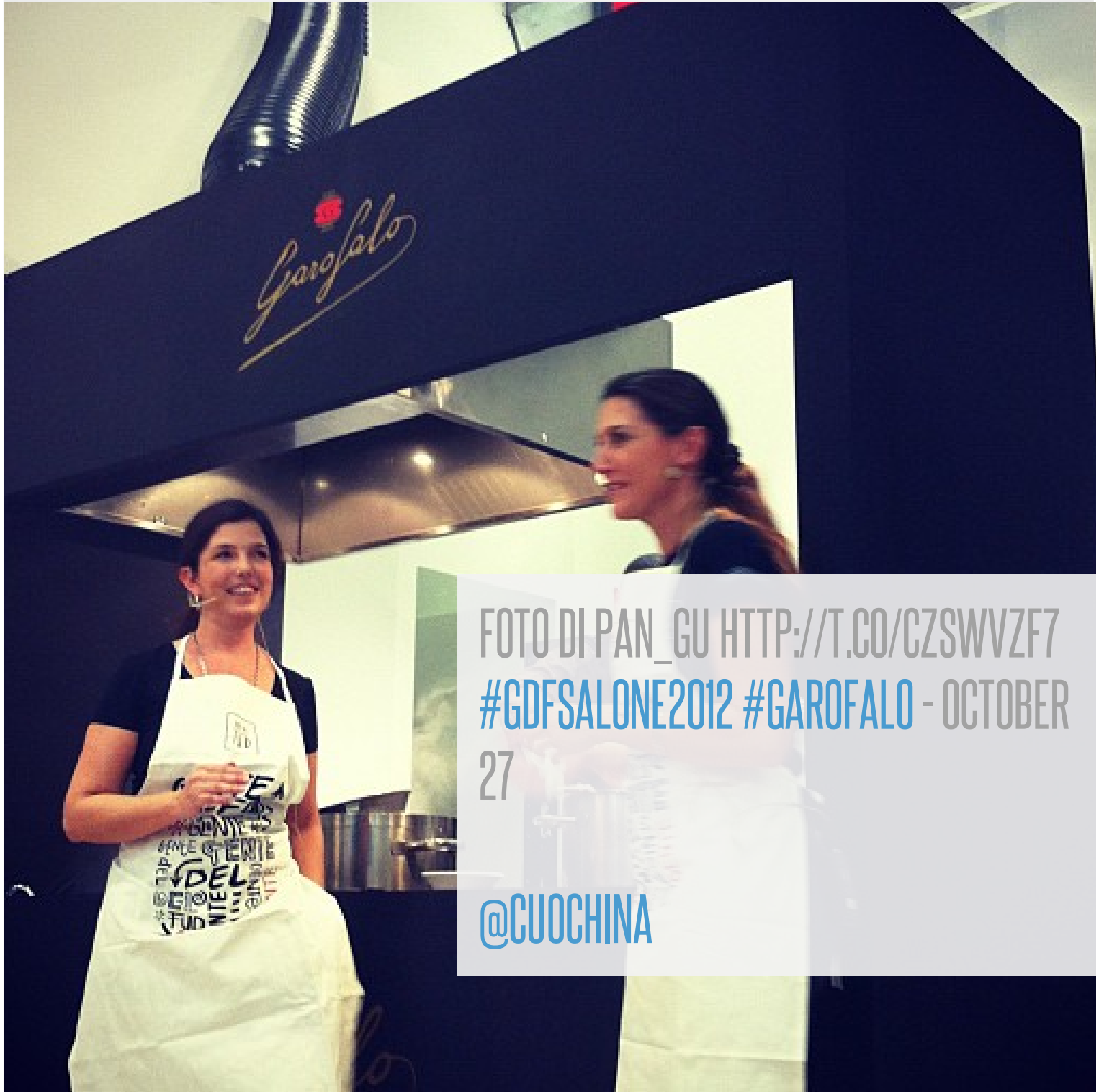
HTTP://T.CO/CZSWVZF7 #GDFSALONE2012 #GAROFALO - OCTOBER